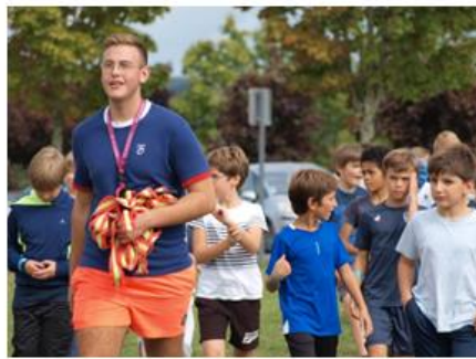
Bac Pro Services Aux Personnes et Aux Territoires