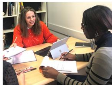
BTS Economie Sociale Familiale