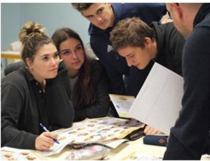
CAPa Services Aux Personnes et Vente en Espace Rural