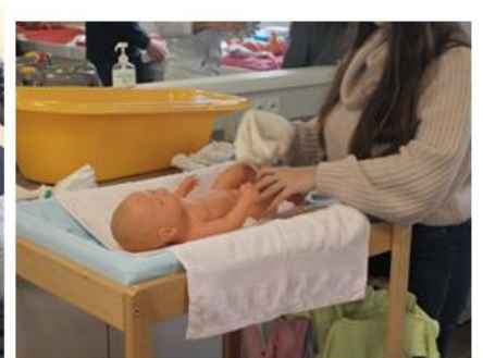
CAP Accompagnant Educatif Petite Enfance