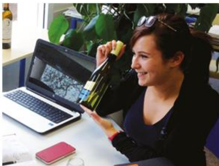
BTSA Technico-Commercial Vins et Spiritueux