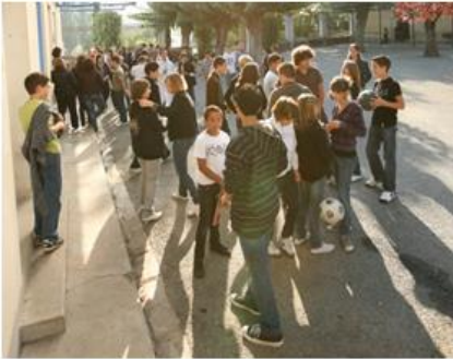
Cursus général Section EGPA