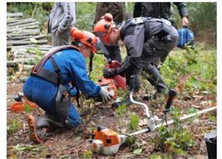
Bac Pro Gestion des Milieux Naturels et de la Faune