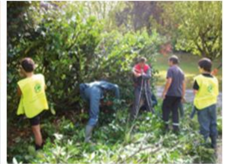
4 ème et 3 ème Prépa Pro